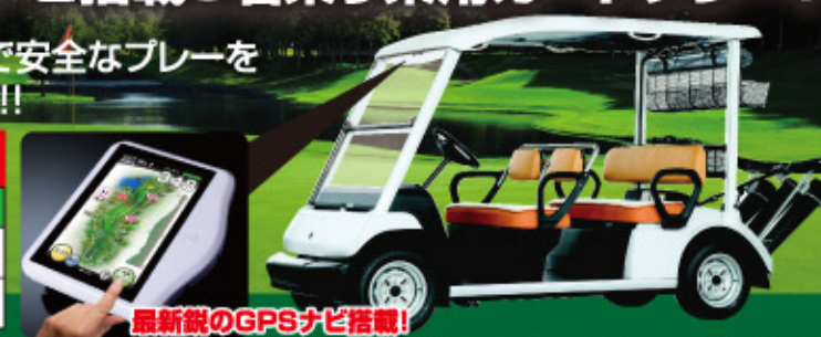
最新鋭のGPSナビ搭載! 画面の10.8インチ大型液晶画面、コースガイドや距離表示、さらにスコア入力、リーダーボード機能も搭載

※上記はキャディー付は4バグ時、セルフは3バグ時・4バグ時の料金です。 ※2名様でのプレーは平日のみ受付しています。 ※表記金額は税別金額となっております。別途消費税とゴルフ場利用税(6月~8月は1,120円)がかかりますのでご了承ください。