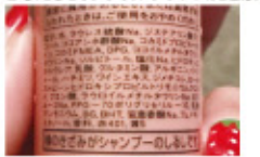
ラウレス硫酸Naの表記が2番目にドーンと

こうして見てみるとメリットデメリットそれぞれですね。アミノ酸やノンシリコンは自然な洗いがりになるけど泡立ちが良くないと結局は摩擦で髪にダメージを与えるし、ラウリルラウレスだと余計な皮脂まで取ってしまう。ただラウリルラウレスの成分の量にもよりますし、他の界面活性剤と混ぜて刺激が弱くないように作られているものもあります。若い頃と違い髪を重くするにつれてなんだか髪がバサバサになってきてる方はまずはシャンプーを変えてみるのも良いかもです。いつもと香りも変わって気分もリフレッシュすることでしょう。ただアミノ酸系ノンシリコンも市販の安価なものよりはクオリティの高い高級シャンプーの方がデメリットは無くなります。あーあ、歳をとるとなんでもお金がかかるもんだわ。