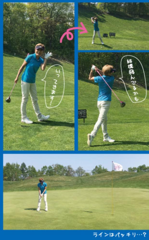
ラインはパッキリ…?