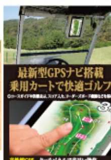
最新型GPSナビ搭載 乗用カートで快適ゴルフ

※A級-Gカップ・HBCラジオCUPは全組セルフとなります。 ※オープンコンペキャディー付追加料金はメンバー1,500円、ビジター3,000円(消費税別)