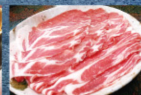
黒豚のしゃぶしゃぶ肉