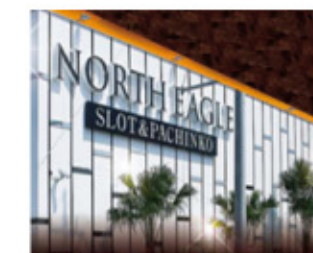
沖縄:ノースイーグル豊見城店