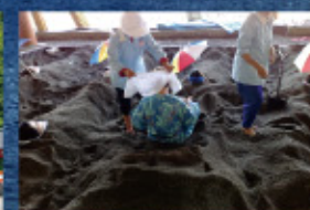
指宿の砂蒸し風呂