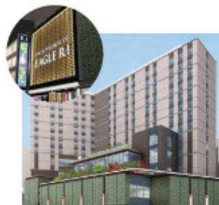
東京:イーグルR-1浅草店