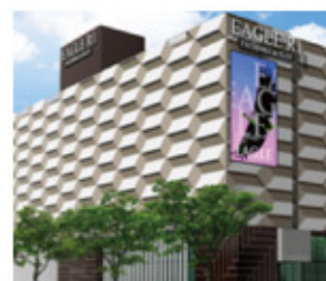
福岡:イーグルR-1太宰府店