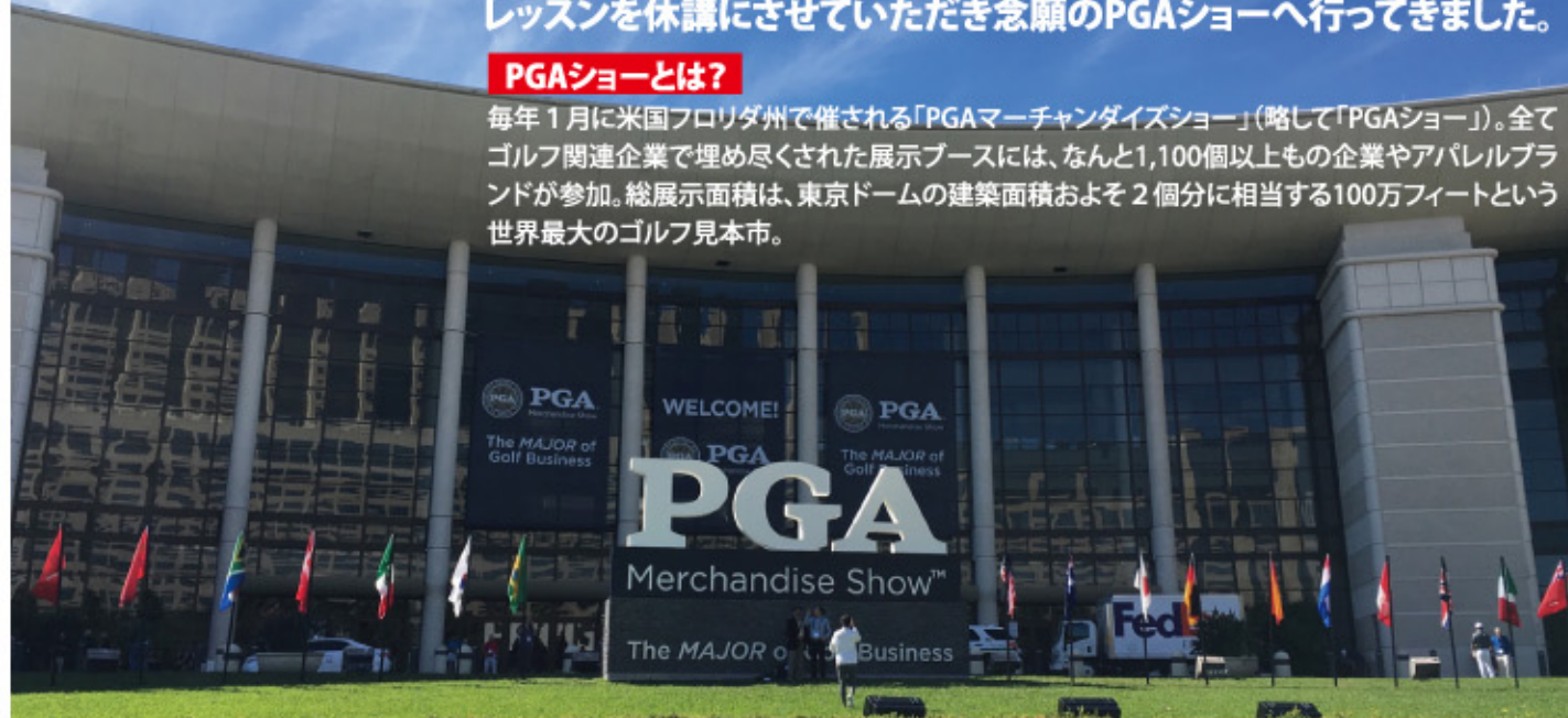
PGAショー2日目会場の、とてつもなくおっきいコンベンションセンター。

毎年1月に米国フロリダ州で開催される「PGAマーチャндаイズショー」(略して「PGAショー」)。全てゴルフ関連企業で埋め尽くされた展示ブースには、なんと1,100個以上の企業やアパレルブランドが参加。総展示面積は、東京ドームの建築面積およそ2個分に相当する100万フィートという世界最大のゴルフ見本市。