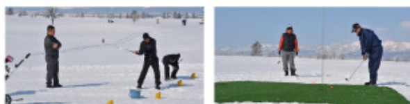
※写真は昨年のもので