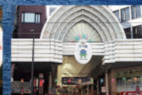
鹿児島県最大の繁華街「天文館エリア」