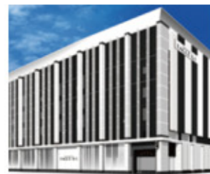
札幌:イーグルR-1南8条店