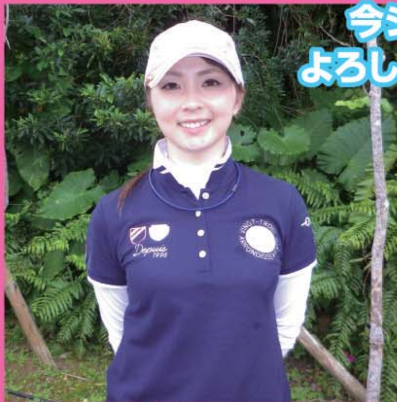
写真/ダイキンオーキッドレディスゴルフトーナメントにて