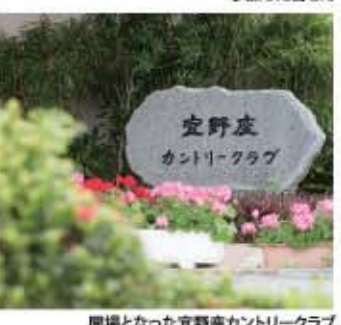
開催となった宜野座カントリークラブ