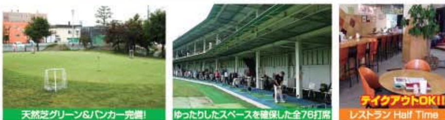
天然芝グリーン&バンカー完備!