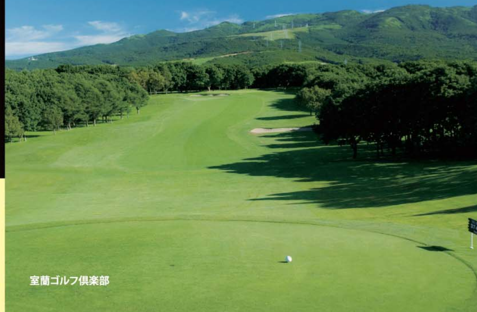
室蘭ゴルフ倶楽部

日本を代表する名匠「井上 誠一氏」設計 高度な戦略性と華麗な造形美を融合した 歴史と赴きのある北海道屈指の名コース