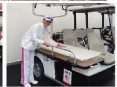
これは必要ですよ。ゴルフ場の救命車!担架付き乗用カートですよ