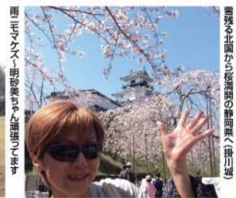
雨、モマクス、明砂美ちゃん頑張ってます