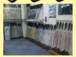
豊富な試打クラブ

クラブを変えたら調子が悪くなった、スライスが直らない、飛距離が落ちた...。それはもしかしたらシャフトが合っていないせいかもしれません。悩む前にまずはフィッティングを体験してリシャフトしてみてもいいかもしれません。ベストフィットのシャフトでゴルフは驚くほど変わります。ゴルフはもっと楽しくなります。事前予約制となっているのでまずは下記までご連絡下さい。