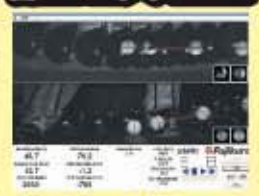
ゴルフインパクト解析システム