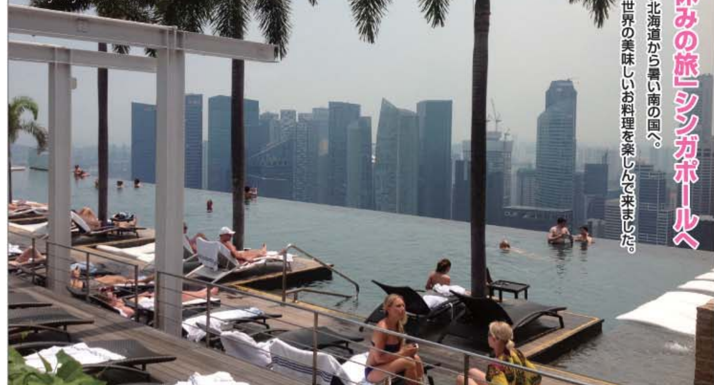
ホテルの57階。水が溢れて落ちそうなプール。下にマリーナが小さく見えるよ。