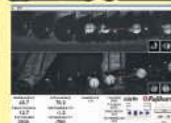
ゴルフインパクト解析システム

札幌市豊平区西岡3条1丁目7-50 ■水曜定休 ヒューマンゴルフガーデン内 ■10:30~19:00