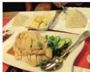
名物の「チキンライス」は必ず食べなきゃ!

市街にある「マリーナ・ベイ・ゴルフコース」パブリックコースなのでホテルのコンシェルジュに頼むと予約もしてくれて、タクシーもかなり安いので1人でも気軽にプレーできます。朝の涼しい時間がお勧め。午後からはスコール注意です。バンカーは全てこんな感じなので出すだけ(≧▽≦)河川敷のコースみたいですがフェアウェイにもバンカーがあり、けっこう難しいんですよ。