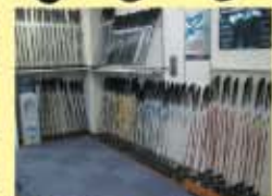
豊富な試打クラブ