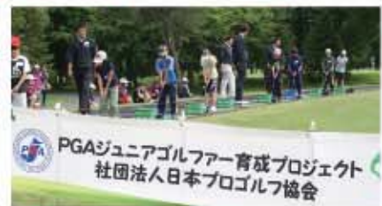
PGAジュニア育成プロジェクト 全国で活動するプロゴルファーが中心となり、ゴルフ未経験の子供達にゴルフの楽しさを伝えることを目的とした全国規模でのゴルフ普及活動