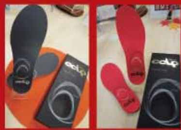
Cal Power Sport

CCLPインソールとは、BMZ次世代型インソール。従来の「BMZ Cuboid Balance理論」に新たな機能を追加し「骨格最適支持」と「一歩目の速さ」を追求します。