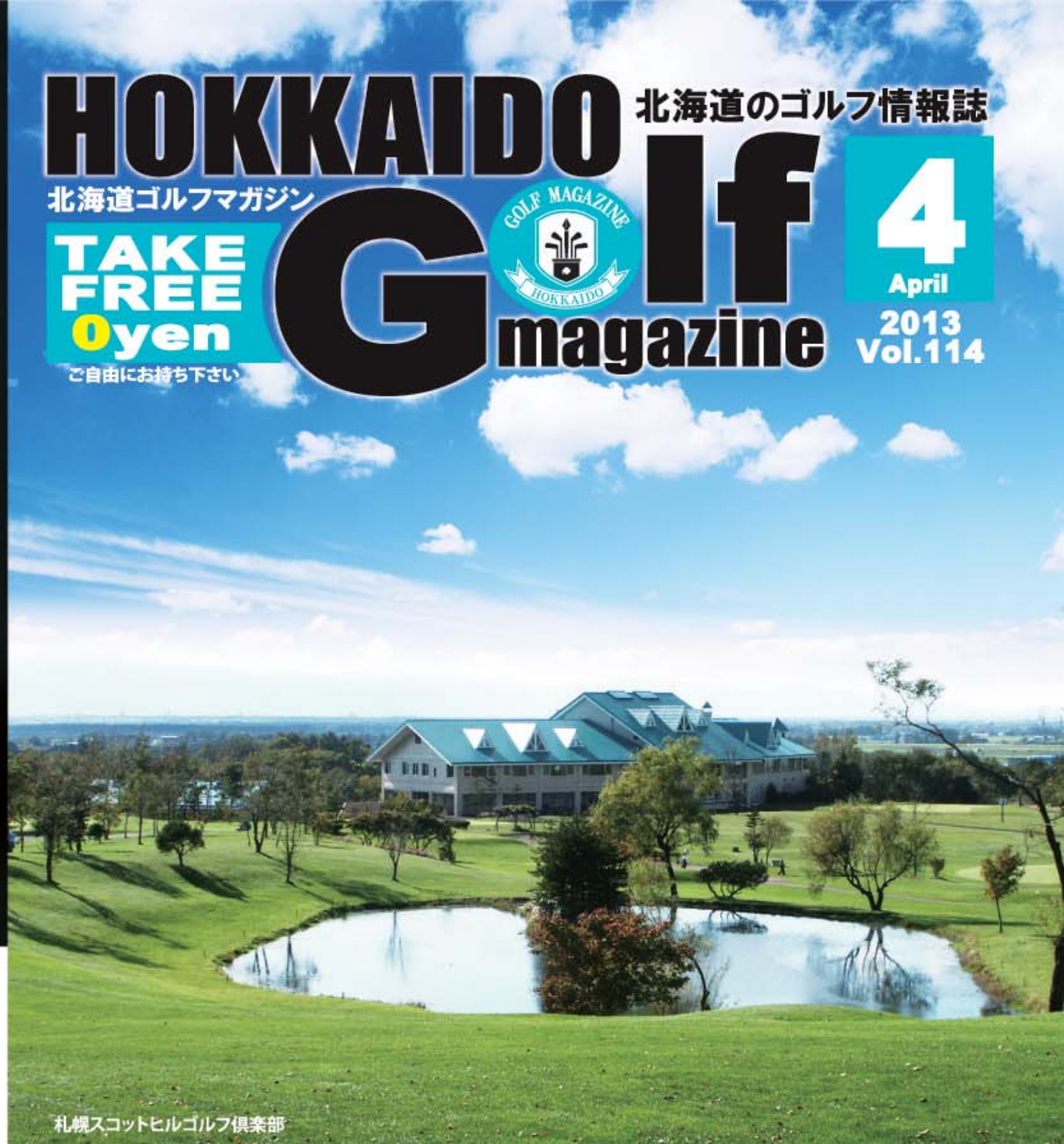
札幌スコットヒルゴルフ倶楽部