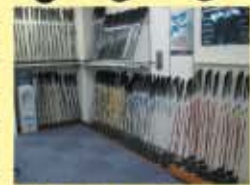
豊富な試打クラブ