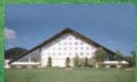
富良野プリンスホテル 富良野市北の峰町18-6 www.princehotels.co.jp/furano