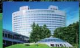
新富良野プリンスホテル 富良野市中御料 www.princehotels.co.jp/newfurano