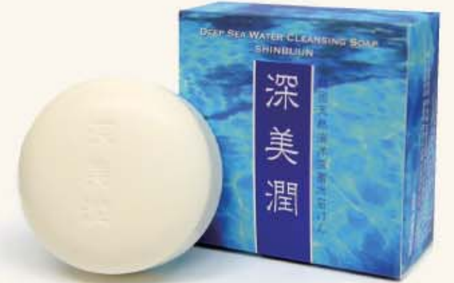
〈化粧石けん〉 深美潤 100g×1個…………… 1,260円(本体1,200円)

発売元 三桜アサツマ商事株式会社 札幌市白石区流通センター1丁目3番28号 TEL:011-861-2151 http://www.sa-corp.jp 製造販売元 株式会社ブルーム 佐賀県唐津市浜玉町浜崎1901-457 http://www.bloom-jp.com/