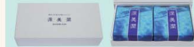
〈化粧石けん〉 深美潤 100g×2個入(化粧箱) 2,520円(本体2,400円)

◆主原料/韓国天然深層水、100%植物性石けん用薬地(パーム/ヤシ油使用) ◆成分/パーム脂肪酸Na・ヤシ脂肪酸Na・水・グリセリン・EDTA-4Na エチドロン酸4Na・塩化Na・香料