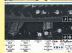
ゴルフインパクト解析システム

札幌市豊平区西岡3条1丁目7-50 ■水曜定休 ヒューマンゴルフガーデン内 ■10:30~19:00