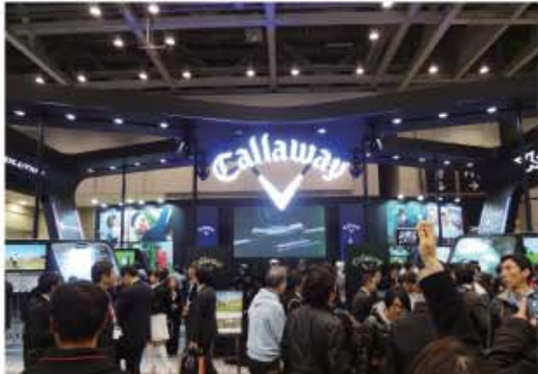
石川遼プロとの契約で飛躍するか。300ヤード飛ばす3Wが話題。