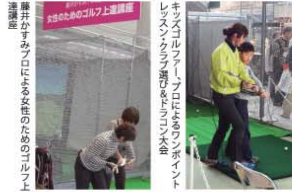
藤井かすみプロによる女性のためのゴルフ上達講座