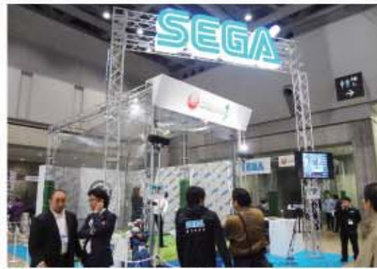
毎回人気のブース。本格的なデータとレッスンでいつもいっぱい。