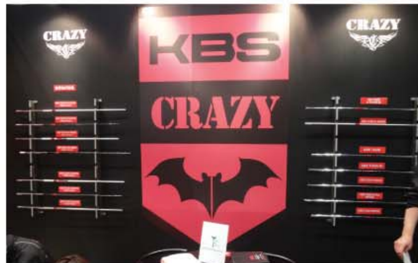
今回はKBSシャフトのみを展示。一本一本丁寧に調整されたクレイジーならではの完成度をアピール。