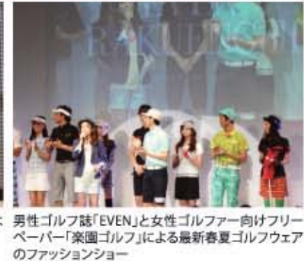
男性ゴルフ誌「EVEN」と女性ゴルファー向けフリーペーパー「楽園ゴルフ」による最新春夏ゴルフウェアのファッションショー