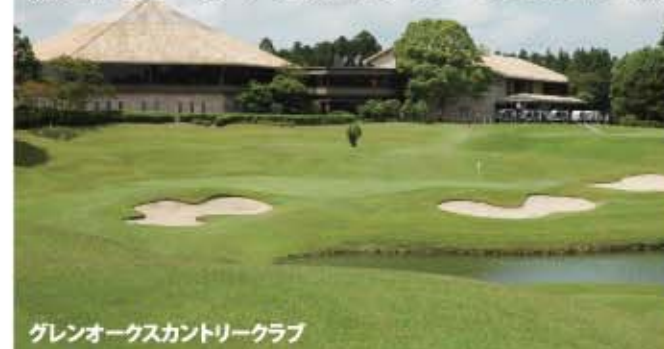
グレンオークスカントリークラブ

林間コース。戦略性に富んだ18Hが続くが、特にアウトは距離が短いだけに捻った造りだ。グリーン手前にグラスバンカーを配したり、ダブルフェアウェイの7番などはどちらに1打を運ぶか考えさせる。一方、インはフェアウェイが広く、長打が楽しめる。アウト・イン共に注意すべきはグリーン。最大1,000平米、平均800平米の大きなグリーンはかなりのアンジュレーションがあり、3パットに悩まされやすい。乗せるにしてもベストな所は絞られている。アイアンの出来が決め手になる。