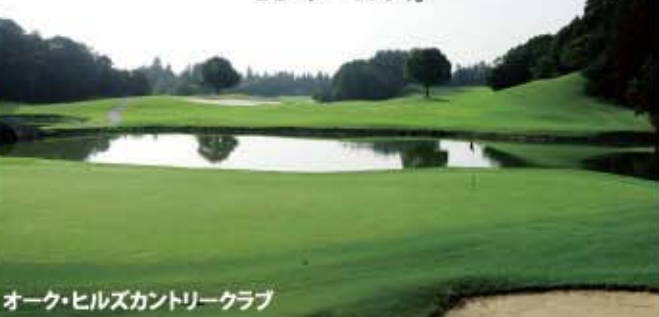
オーク・ヒルズカントリークラブ

ロバート・トレント・ジョーンズ Jr の設計による、日本のゴルフ史上で最初にベント・グラス、ワングリーンを実現し、戦略性を取り入れたコース。北緯台地の豊富な樹木と、効果的に配置されたバンカー、ウォーターハザード、グラスバンカーが、コース、グリーン、アンジュレーションと相まって、飽きのこないコースに仕上がっている。このことは、過去にワールドクラスのツアーや、JLPGA、USシニアツアー競技の開催で証明されている。ドライビングレンジ、アプローチ、バンカーレンジ、パッティンググリーンも完璧。