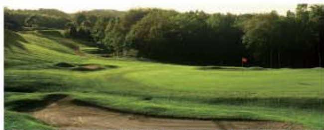
■プレー料金/お一人様、18プレー料金オール乗用カート(3・4バック消費税込)

千歳市協和1392番地 ☎0123-21-2111 http://www.pacificgolf.co.jp/shinchitose/