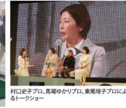
村口史子プロ、馬場ゆかりプロ、東尾理子プロによるトークショー