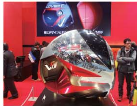
マキロイ、タイガーのCMは話題沸騰中。新しいドライバーはブレイクの予感。今回のベストオブブリスはNIKE。ついに本気を出した。