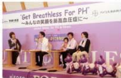
トークセッション