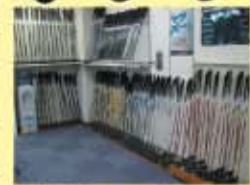
豊富な試打クラブ