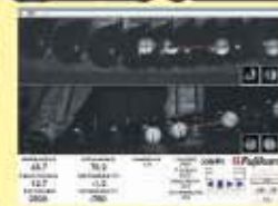
ゴルフインパクト解析システム

札幌市豊平区西岡3条1丁目7-50 ■水曜定休 ヒューマンゴルフガーデン内 ■10:30~19:00