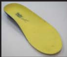
これまでのインソール

こ れまでのインソールは怪我を保護するため、あるいは固定して回復を早めるといった医学からくるものが大半だが、このインソールはスポーツをするため、身体を動かすために開発されたインソールであることから世界で唯一の形状をしているのが特徴である。