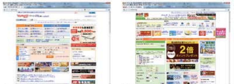
Yahoo!トラベル URL http://travel.yahoo.co.jp 楽天トラベル URL http://travel.rakuten.co.jp

インターネットでヤフトラベル、楽天トラベルなどのWEBサイトで予約しよう。成田空港から近く、無料送迎バスが出ているホテルがお得。成田空港付近はホテルの数も豊富で比較的リーズナブルな料金です。