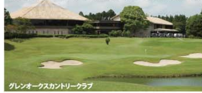
グレンオークスカントリークラブ

林間コース。戦略性に富んだ18ホールが、特にアウトは距離が短いだけに捻った造りだ。グリーン手前にグラスバンカーを配したり、ダブル・フェアウェイの7番などはどちらに1打を運ぶか考えさせる。一方、インはフェアウェイが広く、長打が楽しめる。アウト・イン共に注意すべきはグリーン。最大1,000平米、平均800平米の大きなグリーンはかなりのアンジュレーションがあり、3パットに悩まされやすい。乗せるにしてもベストな所は絞られている。アイアンの出来が決め手になる。