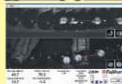
ゴルフインパクト解析システム

札幌市豊平区西岡3条1丁目7-50 ■水曜定休 ヒューマンゴルフガーデン内 ■10:30~19:00