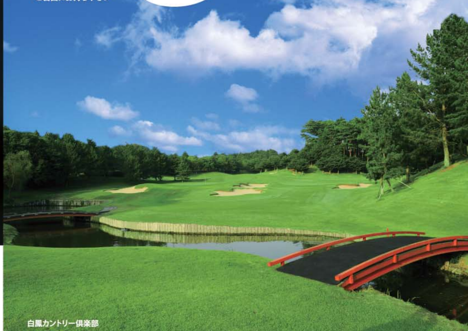
白風カントリー倶楽部