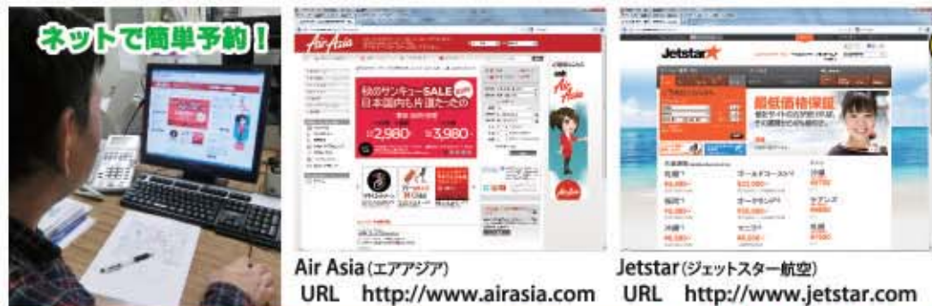
Air Asia (エアアジア) URL http://www.airasia.com Jetstar (ジェットスター航空) URL http://www.jetstar.com

エア・アジアかジェットスターのWEBサイトから往復チケットを予約しよう。もちろん行き先は成田。自宅でチェックインし搭乗券をプリントすることが出来るのでとても便利。