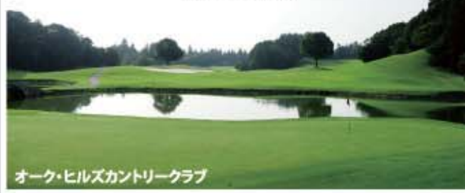
オーク・ヒルズカントリークラブ

ロバート・トレント・ジョーンズ Jr の設計による、日本のゴルフ史上で最初にベント・グラス、ワングリーンを実現し、戦略性を取り入れたコース。北総台地の豊富な樹木と、効果的に配置されたバンカー、ウォーターハザード、グラスバンカーが、コース、グリーン、アンジュレーションと相まって、飽きのこないコースに仕上がっている。このことは、過去にワールドクラスのツアーや、JLPGA、USシニアツアー競技の開催で証明されている。ドライビングレンジ、アプローチ、バンカーレンジ、パッティンググリーンも完璧。