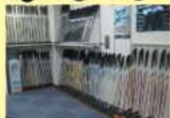
豊富な試打クラブ