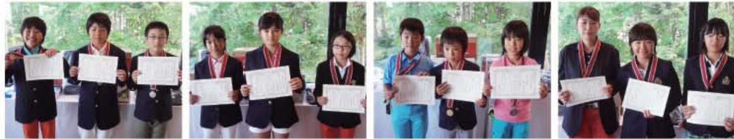
【小学校高学年 男子】