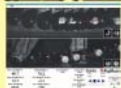
ゴルフインバクト解析システム