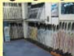
豊富な試打クラブ

クラブを変えたら調子が悪くなった、スライスが直らない、飛距離が落ちた…。それはもしかしたらシャフトが合っていないせいかもしれません。悩む前にまずはフィッティングを体験してリシャフトしてみたいかがでしょうか。ベストフィットのシャフトでゴルフは驚くほど変わります。ゴルフはもっと楽しくなります。 事前予約制となっているのでまずは下記までご連絡下さい。